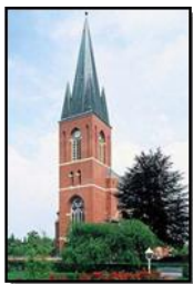
St. Georg Strücklingen