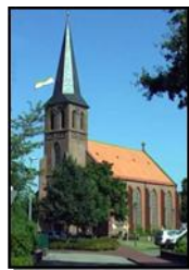
St. Peter und Paul Scharrel